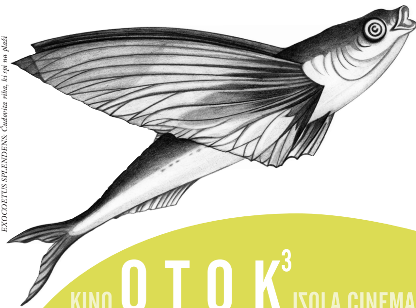
EXOCETUS SPLENDENS: Čudovita riba, ki spi na plaži